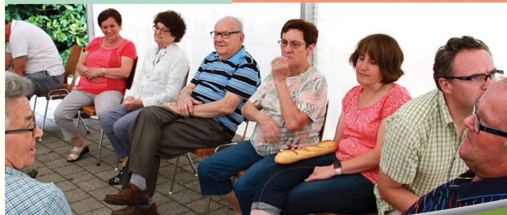
Petit clin d'oeil à l'ami Lucien.